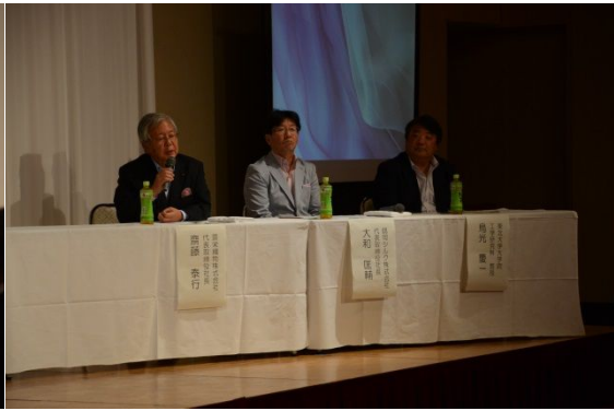
パネリスト：齋藤社長、大和社長、鳥光教授