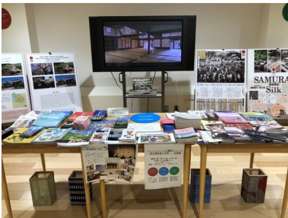
TOHOKU SILK 東北絹産業 (パネリストの企業・大学の展示)